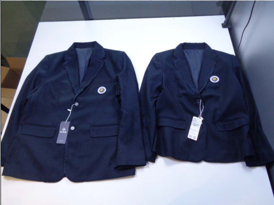
藏青色西服：藏青色西服