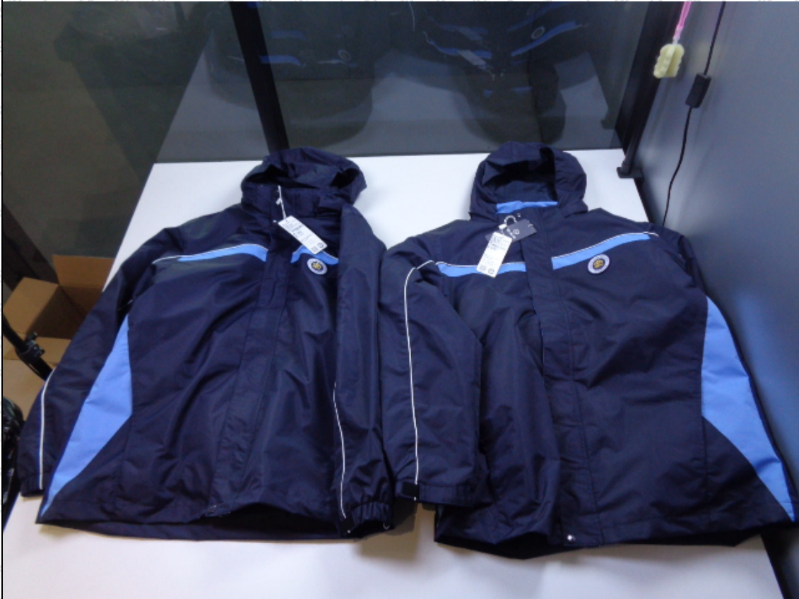
藏青/蓝色外套；藏青/蓝色外套